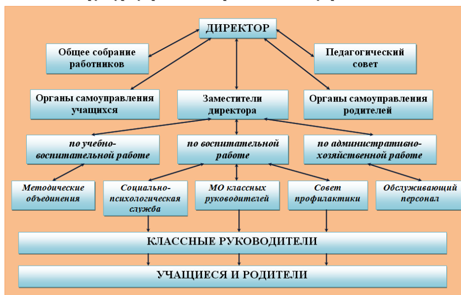
Структура управления образовательным учреждением

Организация педагогического процесса и режим функционирования школы определяется едиными санитарными правилами СП 2.4.3648-20 «Санитарно-эпидемиологические требования к организациям воспитания и обучения, отдыха и оздоровления детей и молодежи». Школа работает в пятидневном режиме для учащихся 1-9